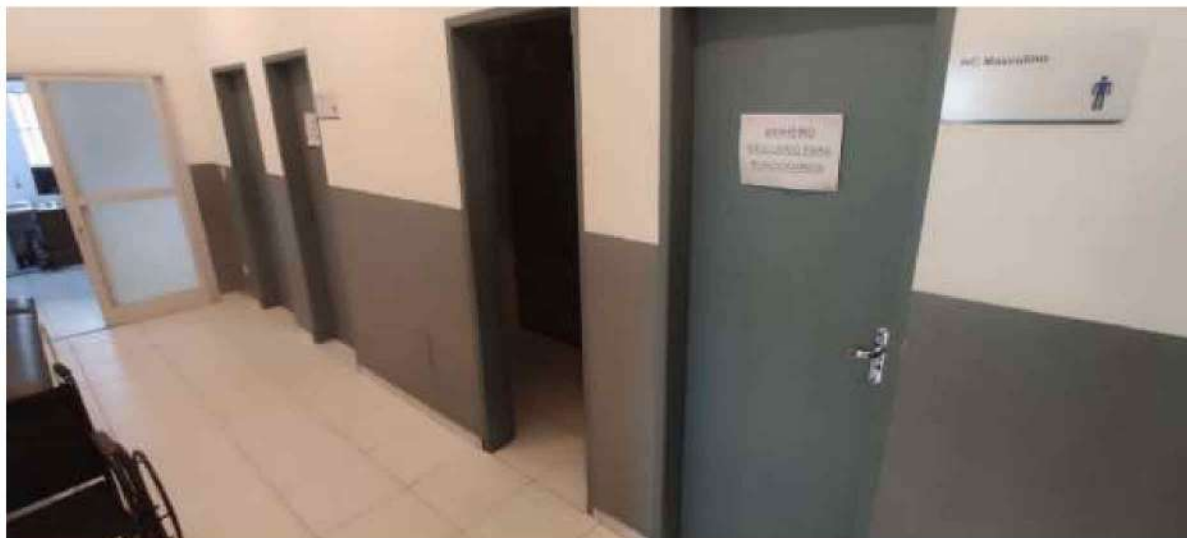
8 – Figura Corredor da UBS – Unidade Básica de Saúde (observação: maca e cadeira de rodas pertence ao município )