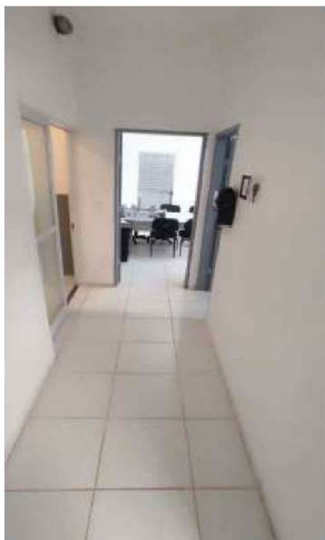
9 – Figura Corredor da UBS – Unidade Básica de Saúde