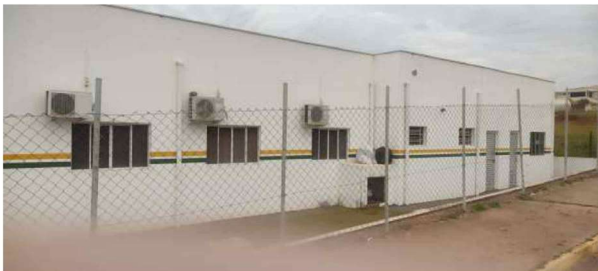
2 – Figura Lateral da UBS