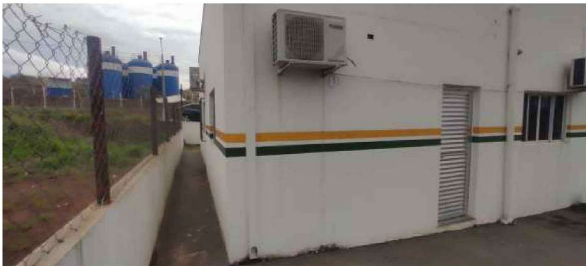
4 – Figura vista da área externa - fundos da UBS