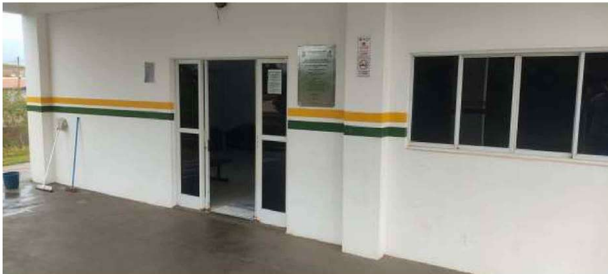
3 – Figura vista frontal da porta de acesso da UBS