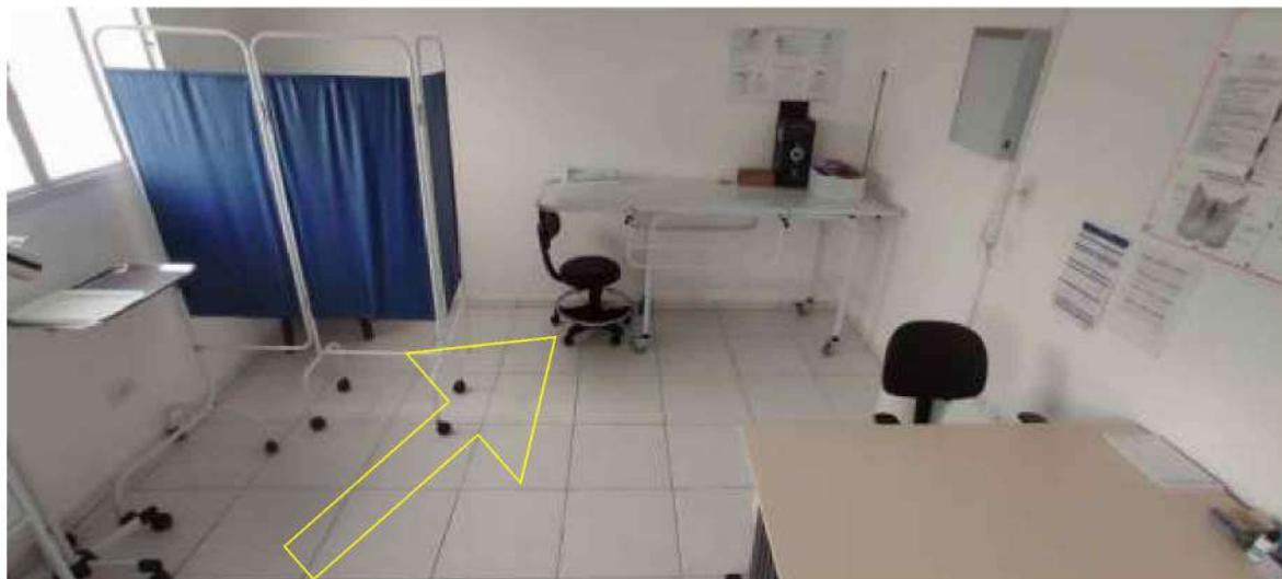
14 – Figura Ginecologia da UBS – Unidade Básica de Saúde (observação: cadeira rotativa preta não pertence ao município)