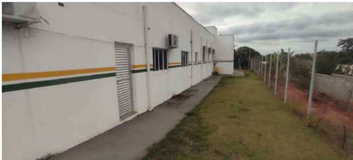
5 – Figura Lateral da UBS – Unidade Básica de Saúde