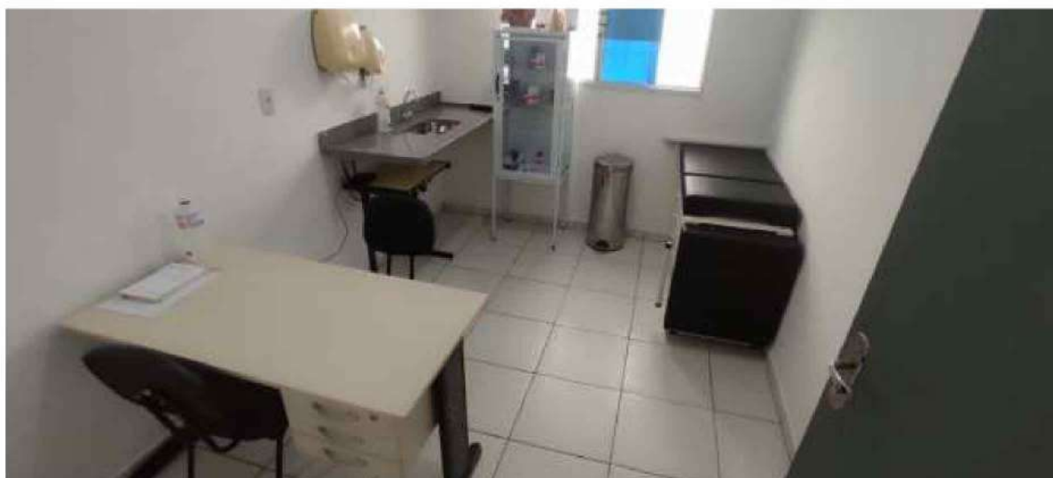
6 – Figura Clínica Geral – Unidade Básica de Saúde (obs: pertencem ao município )