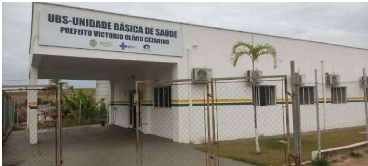
1 – Figura Frontal da UBS – Unidade Básica de Saúde

RUA ANTONIO ROBERTO RONCATO – RESID. LUIS M. COURY