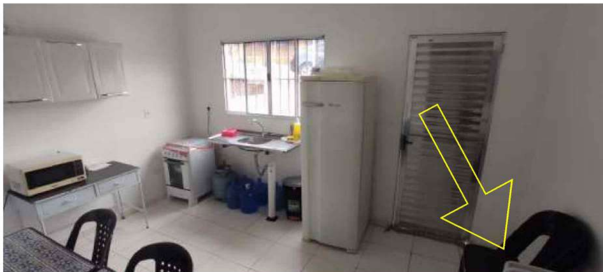
11 – Figura Cozinha da UBS – Unidade Básica de Saúde (observação: 02 un. de mesas brancas e o micro-ondas não pertencem ao município )