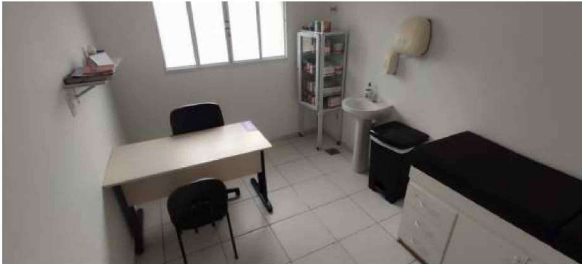
17 – Figura Pediatria da UBS – Unidade Básica de Saúde (observação: cadeira rotativa e lixeira não pertencem ao município )